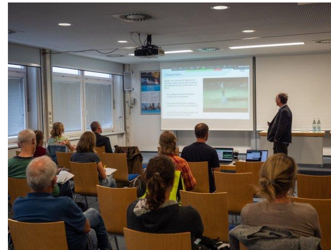
Gemeinsamer Diskussionsabend mit Scientist for Future